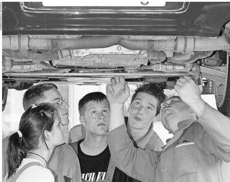
Wie sieht ein Auto von unten aus? Jugendliche schnuppern im Beruf des Automobil-Mechanikers.