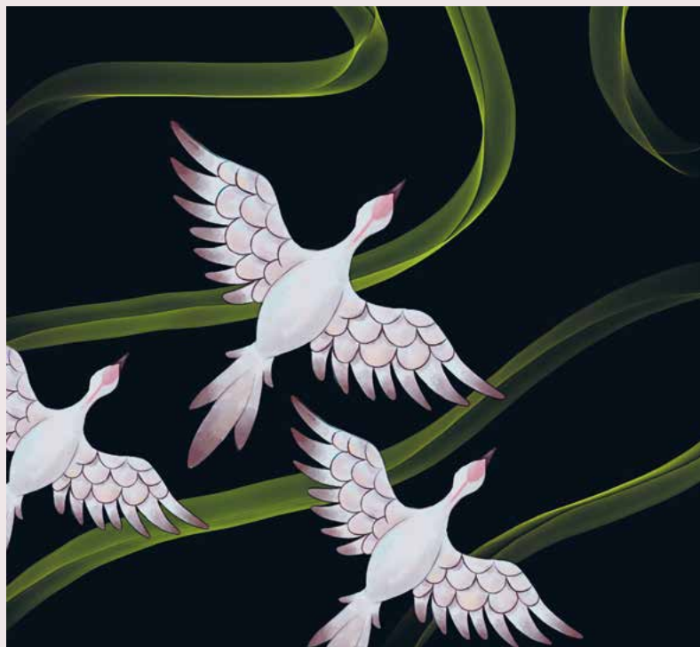
↑ Illustration d'Eden Mizrahi, en 1 re année à l'École supérieure de bande dessinée et d'illustration à Genève

Pendant deux mois, Dragica Vrhovac a troqué son poste chez Sky-Frame, fabricant de fenêtres