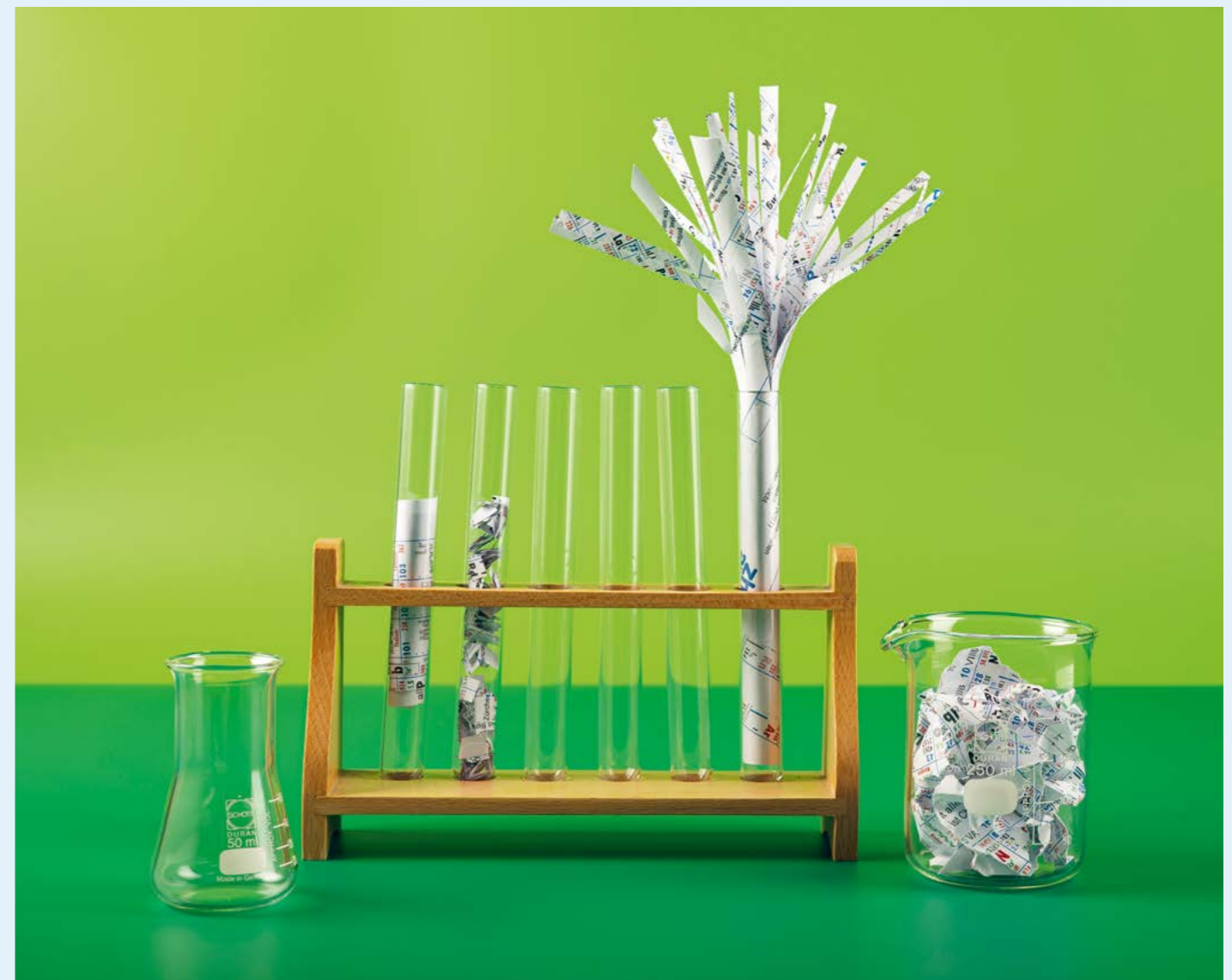
↑ Fotografie von Selina Slamanig , Abschlussjahr Lehrgang Gestalter/in HF Fotografie, Schule für Gestaltung St. Gallen

Die Fallstudien zeigen Aspekte auf, die für die Zukunft der betrieblichen Berufsbildung bedeutend sind. Dazu gehört zunächst ein starkes Commitment des Managements, sich von gewohnten Wegen zu lösen und damit bei sich selbst zu beginnen. Eine Person aus dem Ma-