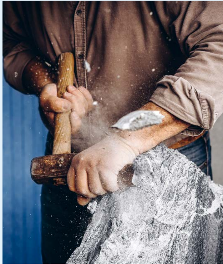
↑ Fotografie von Dario Hässig , Abschlussjahr Lehrgang Gestalter/in HF Fotografie, Schule für Gestaltung St. Gallen

antwortung übernehmen kann, darf, soll, muss», wie eine Person aus dem Management in der IT-Branche beschreibt. Neue Ideen und Konzepte entstehen oft auf Managementebene und finden erst allmählich den Weg zu allen an der betrieblichen Berufsbildung Beteiligten.